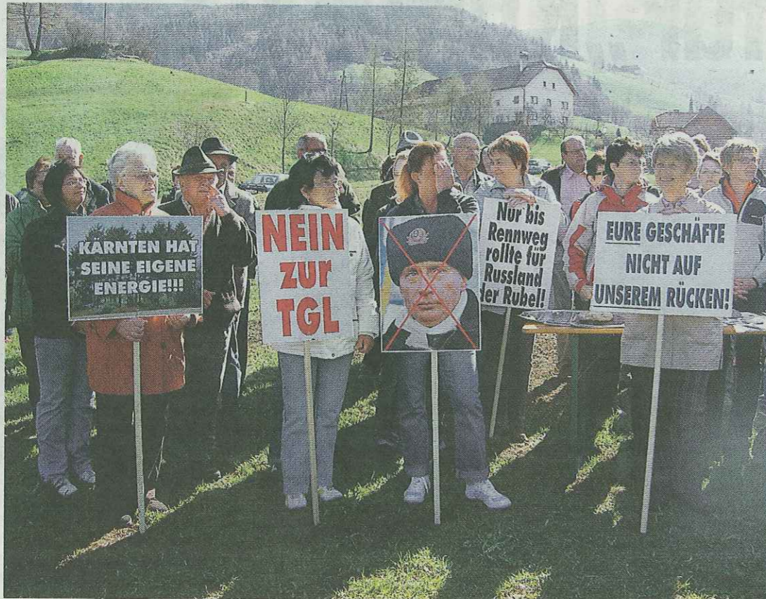
„Eure Geschäfte nicht auf unserem Rücken!": Einige Teilnehmer der gestrigen Aktion gegen den Bau der Tauerngasleitung in Rennweg/St. Georgen taten ihre Meinung via Protesttafeln kund.

Gast: In spätestens 20 Jahren müssen wir die Energiewende ohnehin schaffen, warum also nicht jetzt. Am Sektor Biogas etwa schlummert noch sehr viel Potenzial. Biogas wird Erdgas ablösen.