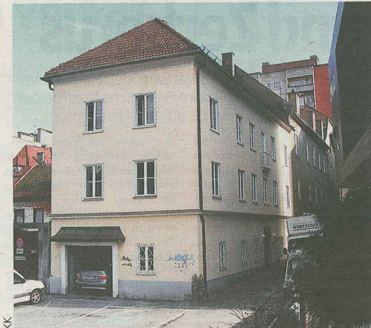
Das neue Firmengebäude von Technik. Der Betrieb ist der größte seiner Art in Österreich und beschäftigt 14 Mitarbeiter.

sich wie das Who is Who der Globalplayer: Für Hewlett-Packard entwickelte Technik ein sicheres Betriebssystem, für Nokia eine Toolbox für Kryptographie-Ingenieure, für Ericsson eine Mobilplattform. Stolz ist Koch darauf, jetzt mit Intel den weltgrößten Industriekonzern an Land gezogen zu haben.